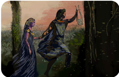
La descente d'Orphée aux Enfers - M. A Charpentier