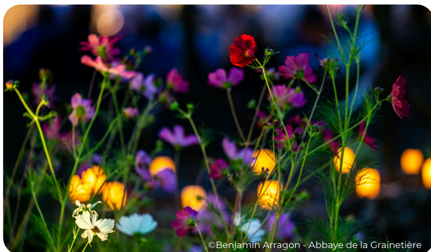
Abbaye de la Grainetière

On y croise les grandes figures de la Renaissance vocale : Josquin Desprez, Roland de Lassus, Clément Janequin, John Dowland, Thomas Morley, Luca Marenzio, Francisco Guerrero, Hans Leo Hassler... mais aussi des compositeurs moins connus, porteurs de joyaux oubliés.