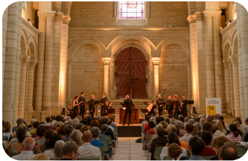
La Stella - Scarlatti(s) père et fils