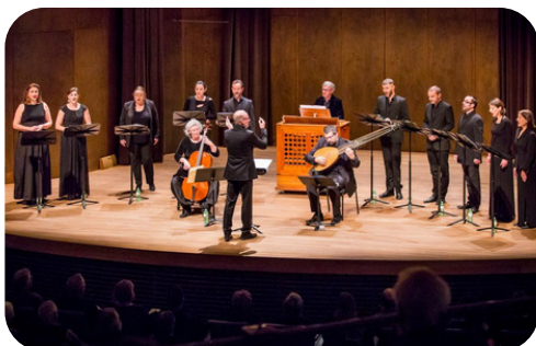
Génération 1685 : Bach - Scarlatti