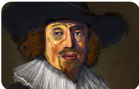
Heinrich Schütz : l'Orphée de Dresde