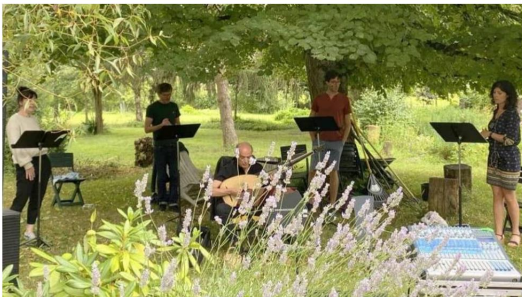
De la terre nourricière au jardin d'Eden, la Renaissance chantera la nature par les voix de l'ensemble Jacques-Moderne.

Durant l'été 2020, l'ensemble Jacques-Moderne était parti en tournée avec un programme d'œuvres de la Renaissance joliment intitulé Gaiement chantons .