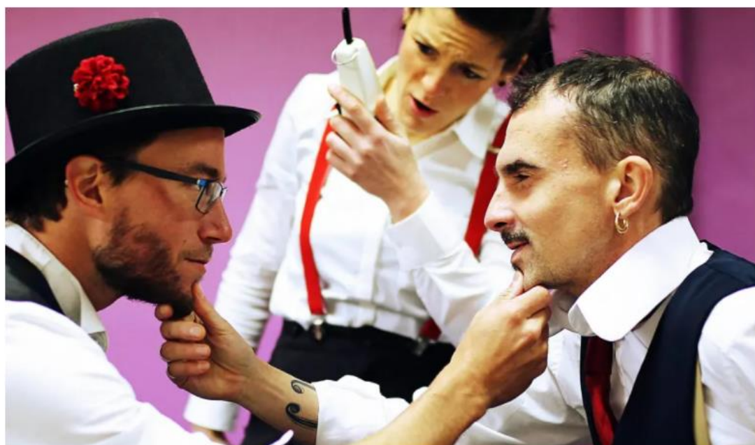
Des tubes rhabillés au son « Made in Beretta ».