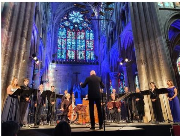
Ensemble Jacques Moderne

L'Ensemble Jacques Moderne, qui s'est produit jusqu'en Amérique ou au Japon, a donné ce dimanche un concert dans sa Touraine d'origine, en l'Église Saint Julien de Tours, dans le cadre des Concerts d'Automne.