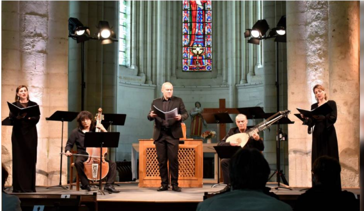
Quelques-uns des artistes avec la viole de gambe, le théorbe et l'orgue.